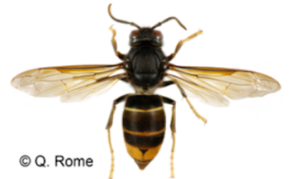
Frelon d'Europe, Vespa crabro